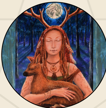
Der Weg der schamanischen Priesterin